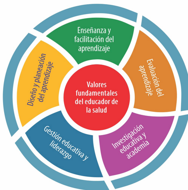
Figura 1. Marco de referencia de los estándares profesionales de educadores médicos, odontológicos y veterinarios

Estos estándares representan un consenso de valores, conocimiento y comportamiento que se esperan de un educador del área de la salud, por ejemplo, en términos de valores que: a) promuevan la calidad y la seguridad de la atención, b) demuestren identidad e integridad profesional, c) estén comprometidos con la academia y la reflexión en la educación en el área de la salud, y d) demuestren respeto por otros. Asimismo, estos estándares consideran cinco dominios de la práctica docente: 1) Diseño y planeación, 2) Enseñanza y facilitación, 3) Evaluación, 4) Investigación educativa y academia, y 5) Gestión educativa y liderazgo. Los valores y los dominios contemplan descriptores, pero estos últimos con diversos niveles que equivalen a ir de novato a experto en términos de actividades que deben ejercerse en la práctica docente ( figura 1 ).