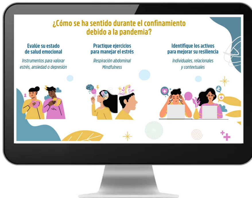
Figura 4. Ejemplos de temas abordados durante el Ciclo de conferencias “La salud mental y emocional para docentes de la Facultad de Odontología”

Entre las principales recomendaciones brindadas a los docentes durante el ciclo de conferencias, destaca la necesidad de incrementar sus prácticas de autoevaluación emocional y de autocuidado (físico y emocional). En palabras de la ponente se enfatizó: “Algo que tenemos que hacer para poder atender nuestra salud mental es aprender a conocernos, aprender a monitorearnos y sensibilizarnos, primero hacia nosotros mismos y luego hacia nuestro entorno”. Asimismo, se invitó a socializar la información y apostar por el apoyo de los especialistas en salud mental para atender los impactos psicológicos que la pandemia tiene en estudiantes y docentes ( figura 4 ).