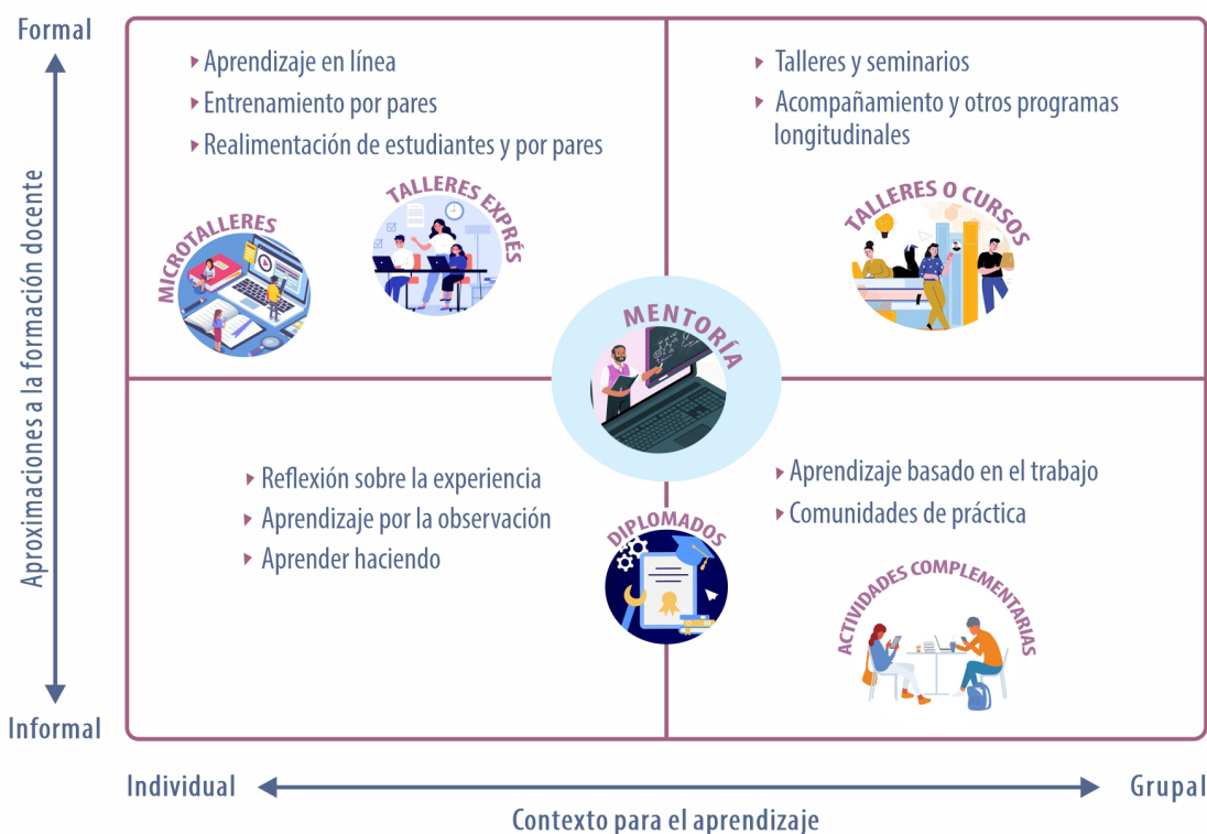
Figura 3. Actividades de la propuesta de formación docente de la FO clasificadas en las aproximaciones a la formación docente de Steinert (2010)

Inicialmente, para hacer real la aplicación integral de los modelos de formación docente, se propuso el Diplomado de Formación Docente para la Enseñanza Preclínica y Clínica en Odontología (FODEPCO) , que consiste en el primer esfuerzo sistemático de la facultad para mejorar el proceso educativo en entornos clínicos tanto simulados como reales.